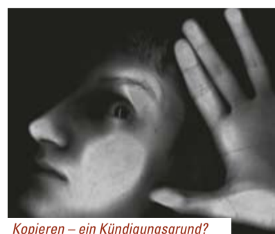
Kopieren – ein Kündigungsgrund?

In der Belegschaft macht sich Wut breit. Alle sind zwischen 15 und 30 Jahren in der Firma, „fast ein Leben lang“, sagt einer – „und jetzt kriegen wir einen Tritt in den Arsch!“ ||