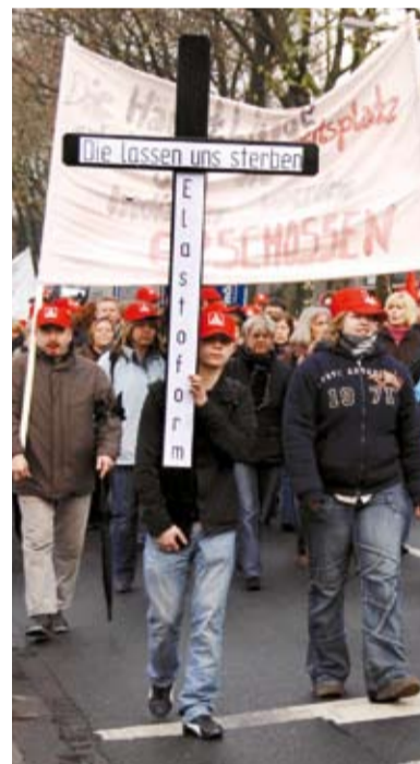
Auf dem Weg zur Betriebsversammlung in der Rheinhausen-Halle: Beschäftigte von Elastoform protestierten am 10. Dezember gegen die geplante Arbeitsplatz-Vernichtung.

Doch IG Metall und Betriebsrat geben sich nicht kampflos geschlagen: „Wir werden ganz genau prüfen, ob das Vorhaben der Geschäftsführung Hand und Fuß hat“, sagt Petra Ahl. „Und wir werden mit den Betroffenen reden – die wissen am besten, was geht und was nicht.“ Betriebsratsvorsitzender Korte sagt: „Wir werden ein Gegenkonzept