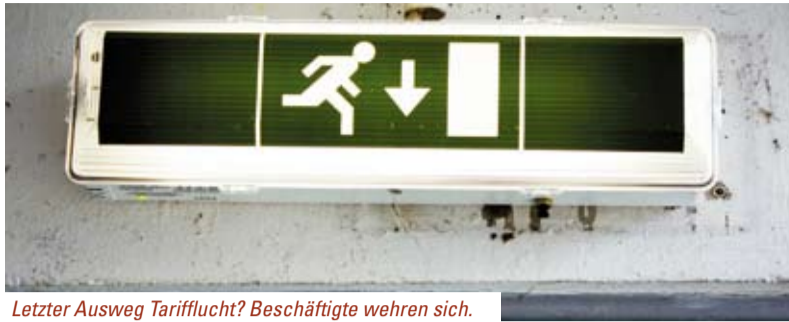
Letzter Ausweg Tarifflicht? Beschäftigte wehren sich.