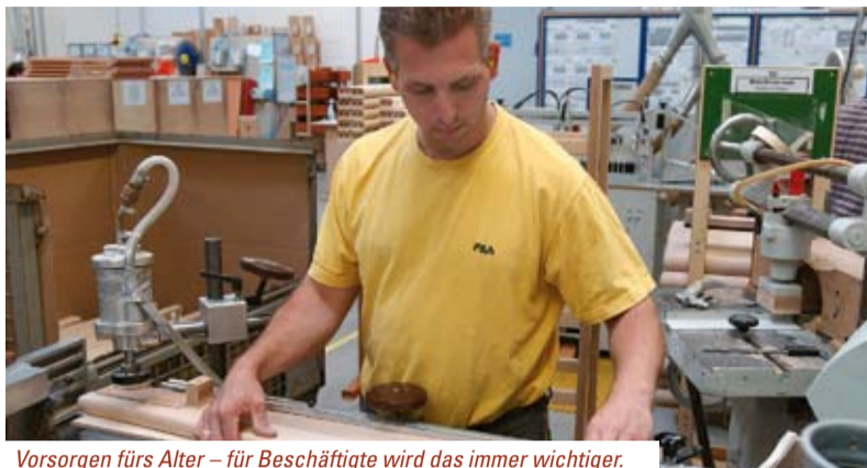
Vorsorgen fürs Alter – für Beschäftigte wird das immer wichtiger.

Das Geld kann in verschiedene Formen der Altersvorsorge gesteckt