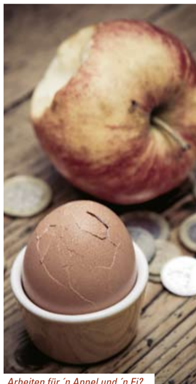
Arbeiten für 'n Appel und 'n Ei?

des Sanierers voraus – und dem wurde er auch gerecht: 25 Beschäftigte wurden entlassen, Huga zählt noch rund 250 Beschäftigte. Und die mussten sich von ihren Chefs immer wieder anhören, dass sie zu viel verdienen. Obwohl die Firma, die zum Jahresende 2008 den Arbeitgeberverband verlässt, jahrelang keine Tarifierhöhung gezahlt hat. Und sich auch bei der Bezahlung von Mehrarbeitszuschlägen sehr stark zurückhielt.